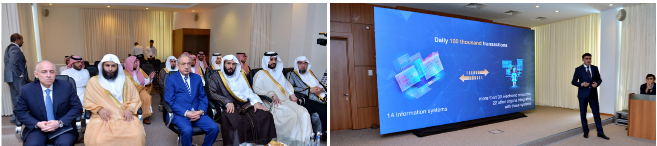
Ölkəmizin ədliyyə sahəsindəki innovasiyalarla tanışlıq

Dövlətimizin başçısının rəhbərliyi ilə məhkəmə-hüquq sistemində aparılan genişmiqyaslı islahatlar və yeniliklər, xüsusilə bu sahədə yeni mərhələ olan ölkə Prezidentinin 2019-cu il 3 aprel tarixli