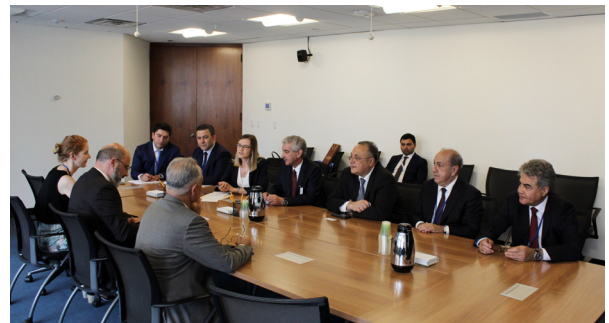
BMT Baş katibinin inkişaf və əlaqələndirmə məsələləri üzrə müşaviri Robert Piper ilə görüş

Tədbirlərdə və görüşlərdə Ermənistan-Azərbaycan Dağlıq Qarabağ münaqişəsi haqqında bir daha məlumat verilib, münaqişə nəticəsində Azərbaycan torpaqlarının 20 faizinin işğal olunduğu, 1 milyondan çox soydaşımızın yurd-yuvalarından qaçqın və məcburi köçkün düşdüyü, bütün bunların ölkədə dayanıqlı inkişaf məqsədlərinə nail olunmasında çətinliklər yaratdığı vurğulanıb, BMT-nin Təhlükəsizlik Şurasının münaqişəyə dair qəbul etdiyi məlum qətnamələrinin indiyədək yerinə yetirilmədiyini bildirilib.