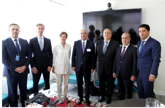
BMTİP-in Baş direktorunun müavini, BMTİP-in Avropa və MDB üzrə Regional Bürosunun direktoru Miryana Spolyariç Eqqer ilə görüş

müxtəlif qurumları ilə səmərəli əməkdaşlığın davam etdirilməsi, bu əməkdaşlıq çərçivəsində bir sıra mühüm sənədlərin imzalanması diqqətə çatdırılıb. Habelə xanım Amina Mohammed dayanıqlı inkişafın əsas məqsədlərindən birinin qanunun aliliyinin təşviqi və hamı üçün ədalət mühakiməsinə əlçatanlığın asanlaşmasının olmasını nəzərə alaraq, tədbirdə Azərbaycan