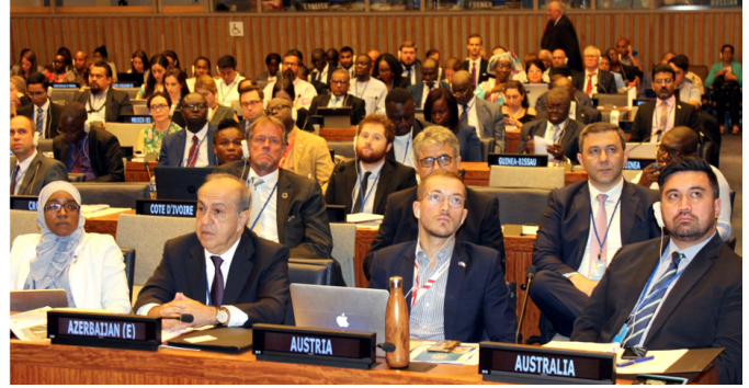
BMT-nin Yüksək Səviyyəli Siyasi Forumu

I yulun 15-də Birləşmiş Millətlər Təşkilatının (BMT) Nyu Yorkdakı Baş Qərargahında təşkil olunmuş Dayanıqlı İnkişafa dair Yüksək Səviyyəli Siyasi Forumda Azərbaycan Respublikasının İkinci Könüllü Milli Hesabatı uğurla təqdim olunub və iştirakçı ölkələrin, BMT və digər beynəlxalq təşkilatların nümayəndələri tərəfindən müsbət qiymətləndirilib.