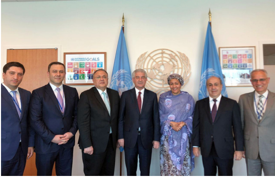
BMT Baş katibinin birinci müavini xanım Amina Mohammed ilə görüş