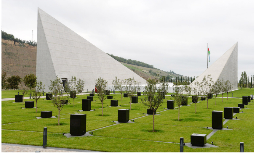
Quba Soyqırımı Memorial Kompleksi

Bu dəhşətli faciəyə yalnız müstəqillik dövründə ümum-