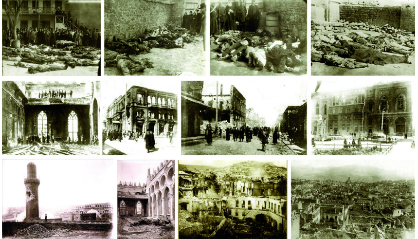
1918-ci il mart soyqırımının nəticələri

milli lider Heydər Əliyevin hakimiyyətə qayıdışından sonra siyasi-hüquqi qiymət verilib, Ulu Öndərin 1998-ci ildə imzaladığı Fərmanla martın 31-i Azərbaycanlıların Soyqırımı Günü elan olunaraq hər il soyqırım qurbanlarının xatirəsi ölkəmizdə və onun hüdudlarından kənarda anılır.