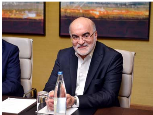
İranda Dövlət Baş Müfəttişliyinin sədri Naser Seraj ilə görüş

İran İslam Respublikasının Dövlət Baş Müfəttişliyinin sədri Naser Seraj ilə keçirilmiş görüşdə xalqlarımız arasında dostluq və əməkdaşlıq münasibətlərinin inkişafından məmnunluq ifadə olunaraq bu əlaqələrin dərinləşməsində dövlət başçılarının xüsusi rolu və qarşılıqlı səfərlərinin mühüm əhə-