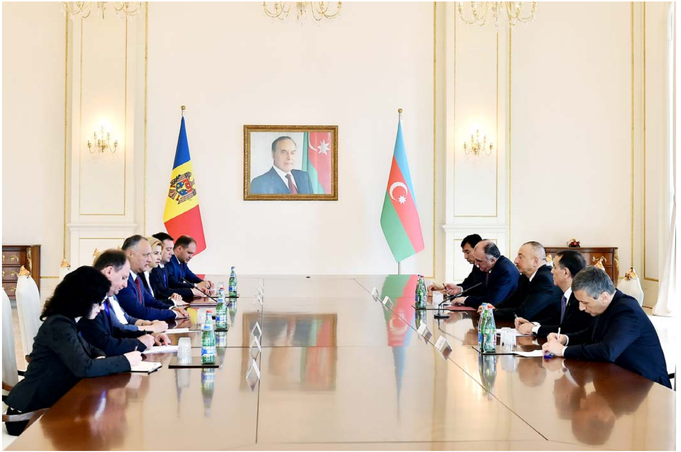
Geniş tərkibdə görüş

kəmləndirilməsində çox mühüm addım olacağına əminlik ifadə olunub, əlaqələrimizin müxtəlif sahələrdə, o cümlədən siyasi, ticari-iqtisadi, energetika və nəqliyyat sahələrində inkişaf etdirilməsi üçün böyük perspektivlərin olduğu vurğulanıb. Söhbət zamanı həmçinin, regionlararası əlaqələr, humanitar əməkdaşlıqla bağlı məsələlər müzakirə edilib.