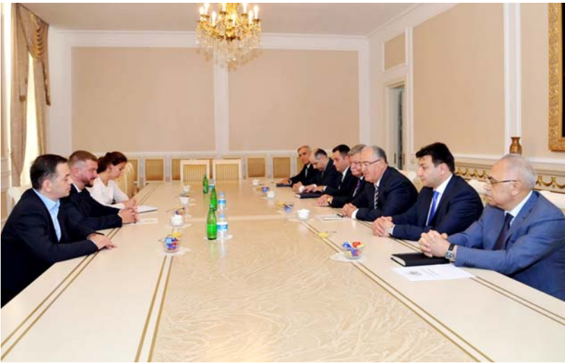
Ali Məhkəmədə görüş