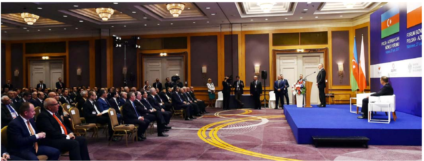
Polşa-Azərbaycan biznes forumu

Həmçinin, 2005-ci il martın 30-da Varşava şəhərində imzalanmış iki ölkənin hökumətləri arasında müdafiə sahəsində əməkdaşlıq haqqında Sazişdə dəyişikliklər edilməsi barədə Protokol, Energetika nazirlikləri arasında energetika sahəsində, Azərbaycanın Nəqliyyat, Rabitə və Yüksək Texnologiyalar Nazirliyi ilə Polşanın İnfrastruktur və Tikinti Nazirliyi və Dəniz İqtisadiyyatı və Daxili Naviqasiya Nazirliyi arasında nəqliyyat və nəqliyyat infrastrukturunu sahəsində, Dövlət Neft Şirkətinin Bakı Ali Neft Məktəbi ilə AGH Elm və