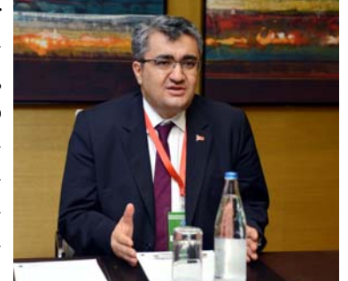
Türkiyənin Baş Prokurorunun müavini Halil Adıgözəl ilə görüş

Eyni zamanda, Türkiyənin Baş Prokurorunun müavini Halil Adıgözəl ilə görüş keçirilərək dost və qardaş ölkələrimiz arasında bütün istiqamətlərdə, o cümlədən hüquqi sahədə əməkdaşlığa dair danışıqlar aparılıb, Türkiyədə bu sahədə islahatların həyata keçirildiyi nəzərə alınaraq Azərbaycanın nailiyyətlərinə maraq göstərilib, təcrübə mübadiləsinin əhəmiyyəti qeyd edilib.