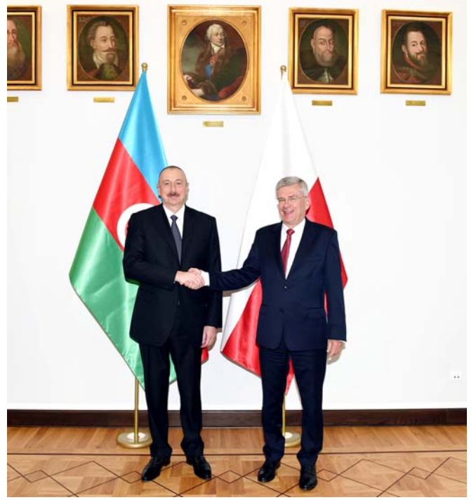
Polşa Respublikası Senatının marşalı Stanislav Karçevski ilə görüş

İkitərəfli əməkdaşlığın uğurla inkişaf etdiyini deyən Prezident İlham Əliyev Polşanın BMT Təhlükəsizlik Şurasının qeyri-daimi üzvü seçilməsi münasibətilə təbriklərini çatdırıb. Qeyd edib ki, Azərbaycan və Polşa beynəlxalq təşkilatlarda, o cümlədən BMT-də və Avropa strukturlarında uğurla əməkdaşlıq edirlər. Dövlətimizin başçısı beynəlxalq