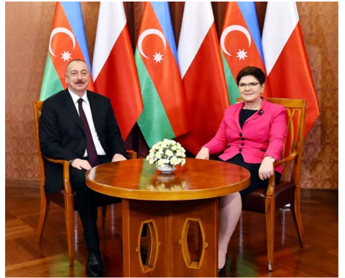
Polşa Respublikasının Baş naziri xanım Beata Şidlo ilə görüş

nəqliyyat dəhlizlərinin yaradılmasında Azərbaycanın fəal iştirak etdiyini və bu istiqamətdə Polşa ilə əməkdaşlığın yaxşı perspektivlərə malik olduğunu vurğulayıb.