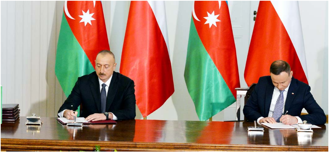
Azərbaycan-Polşa sənədlərinin imzalanması

qətnaməsi əsasında həll olunmasını dəstəkləyir.