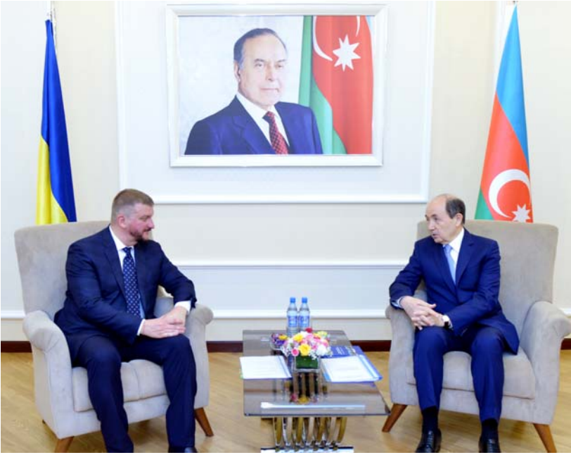
Ədliyyə Nazirliyində görüş