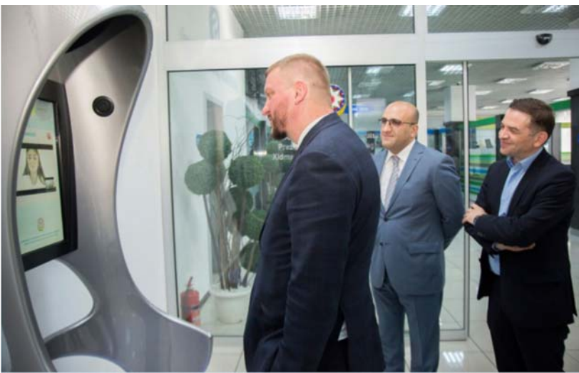
"ASAN xidmət"lə tanışlıq

məzarlarını ziyarət edərək Əbədi məşəl abidəsi önünə əklil qoyublar.